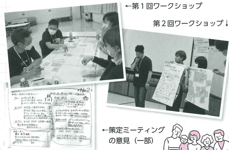
←第1回ワークショップ