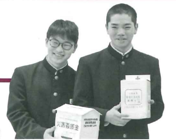
雫石中学校生徒会

日本赤十字社では、令和6年1月に発生した地震で被災された方々の生活再建の一助とするため、「令和6年能登半島地震災害義援金」の受付を行っております。雫石中学校生徒会をはじめ、すでに多くの個人・団体の皆さまにご協力をいただき、令和6年3月20日現在、日本赤十字社雫石町区分を通じて、被災地へ送金した募金額は、総額642,151円となりました。お送りした義援金は、被災各県の義援金配分委員会で市区町村等の自治体に配分されたのち、被災地で苦しんでいるの方々へ届けられ、生活再建に役立てられます。ご協力いただいた皆さま、ありがとうございました。