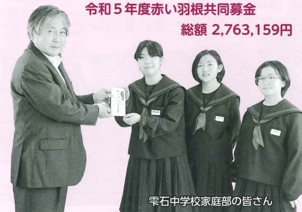
栗石中学校家庭部の皆さん