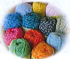
皆さまから寄せられた毛糸は...