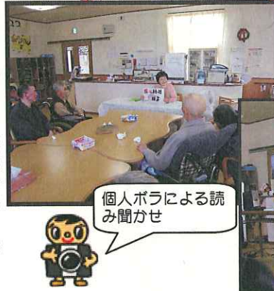
個人ボラによる読み聞かせ

このように、ボランティアの活用がスムーズに行われます。また、逆にボランティアの活用も、町内各所に設置されたボランティアセンターを通じて、ボランティアの登録や活動の依頼など、ボランティアの活用がスムーズに行われます。