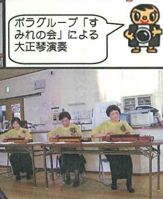
ボラグループ「すみれの会」による大正琴演奏

① ボランティア募集依頼を「ぼらっと」の掲示板に掲載依頼。② 掲示板コーナーを見て「やっさんが良い」というボランティアさんを見つけたら、掲示板へ連絡。③ ボランティアセンターが施設とボランティアをコーディネートし、ボランティアの活用がスムーズに行われます。